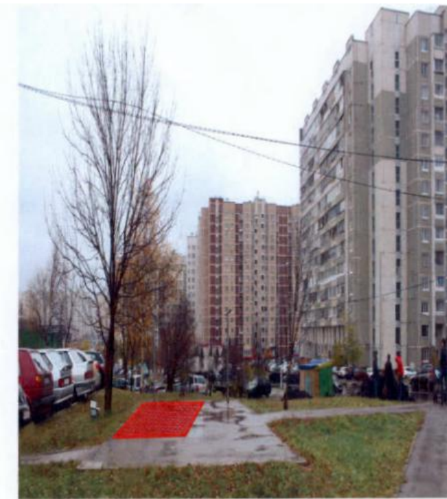
Адресные ориентиры: ул. Старобитцевская, д.19 Вид объекта: Лоток Специализация: мороженое