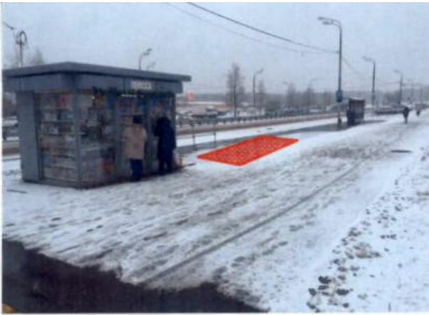
Адресные ориентиры: Бульвар Дмитрия Донского, д. 16 Вид объекта: Лоток Специализация: мороженое